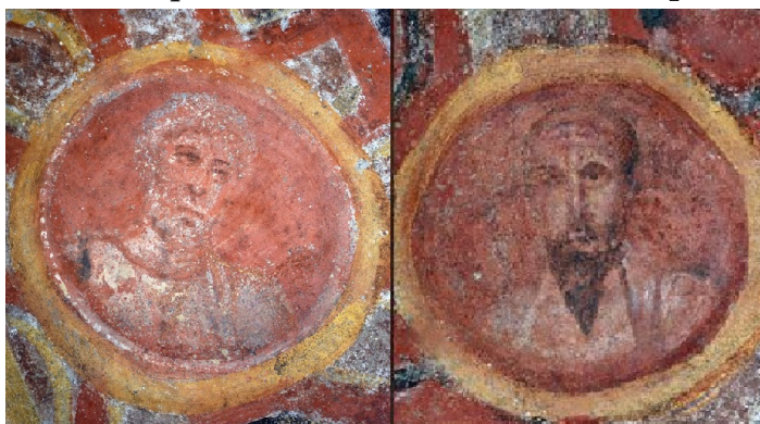
Древнейшие иконы апостолов Петра и Павла. Катакомбы св. Феклы, Рим, IV век.

из двух противоположных стихий — огня и воды. Учитесь здесь, все враждующие, истинному единомыслию и дружбе на примере этой двоицы апостольской, и вы достигнете земли обетованной, Царствия Небесного.